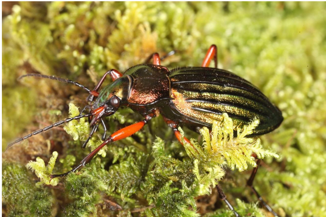
Carabus auronitens intercostatus , Subendemit Österreichs im Gesäuse fotografiert.

Im Rahmen einer internationalen Schutzgebietstagung in Salzburg fand eine eigene Session zum Thema Endemiten statt, die ganz wesentlich durch Beiträge aus dem Nationalpark Gesäuse geprägt wurde. Die Darstellung der Ergebnisse erfolgte im Symposiumsband „6th Symposium for Research in Protected Areas 2 to 3 November 2017, Salzburg“.