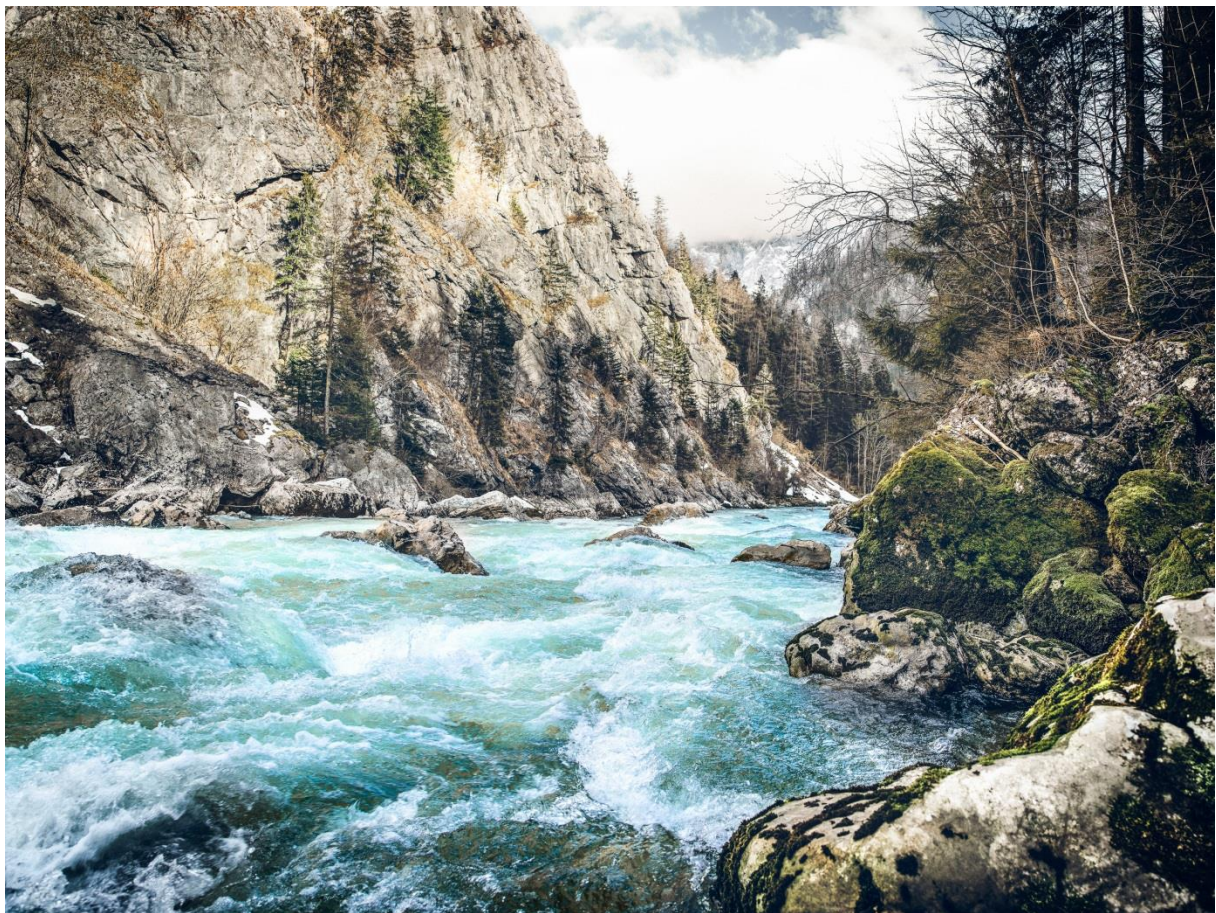
Wildes Wasser, steiler Fels: Die Dynamik der Landschaft macht den Nationalpark Gesäuse zu einem besonderen Schutzgebiet.

Ziel und Inhalt des ELER Projektes „Schutzgutinventar Nationalpark Gesäuse“ ist es dieses Alleinstellungsmerkmal noch weiter herauszuarbeiten, und die speziellen Schutzgüter und deren Ansprüche noch besser zu erforschen.