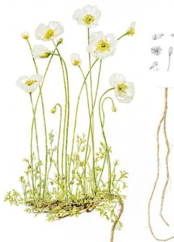
Papaver alpinum subsp. alpinum s. str.