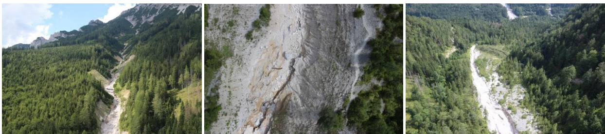
Naturprozesse wie Muren, mit Erosion und Überschüttung prägen die Dynamik des Kühgrabens.