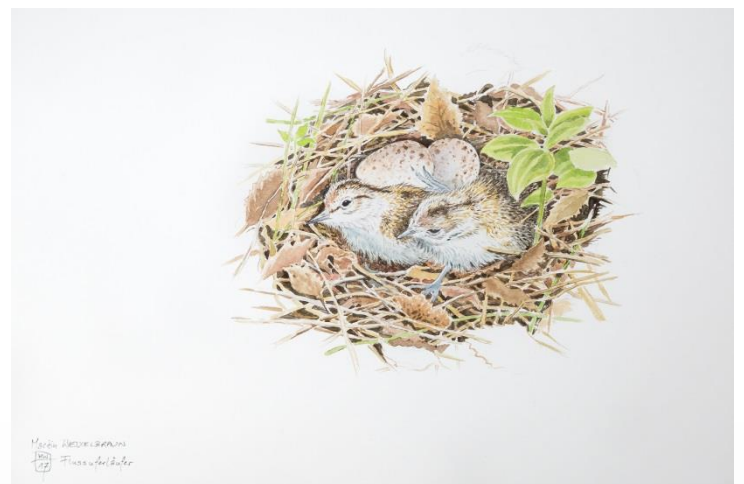
Der Flussuferläufer („Fluffi“), das „Maskottchen“ des Nationalparks Gesäuse (Illustration: Martin Weixelbraun).