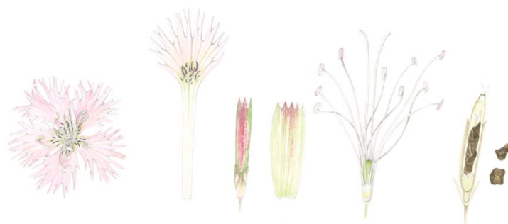
Die Zierliche Federnelke, der Endemit des Gesäuses (Illustration: Magareta Pertl).