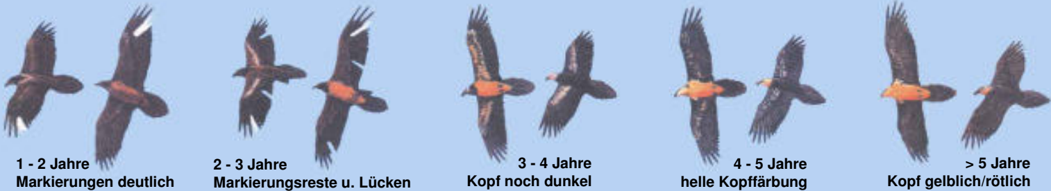
1 - 2 Jahre Markierungen deutlich

Grafiken: El Quebrantahuesos en los Pireneos (R. Heredia y B. Heredia); Ministerio de Agricultura Pesca y Alimentación. Publicaciones del Instituto Nacional para la Conservación de la Naturaleza, 1991