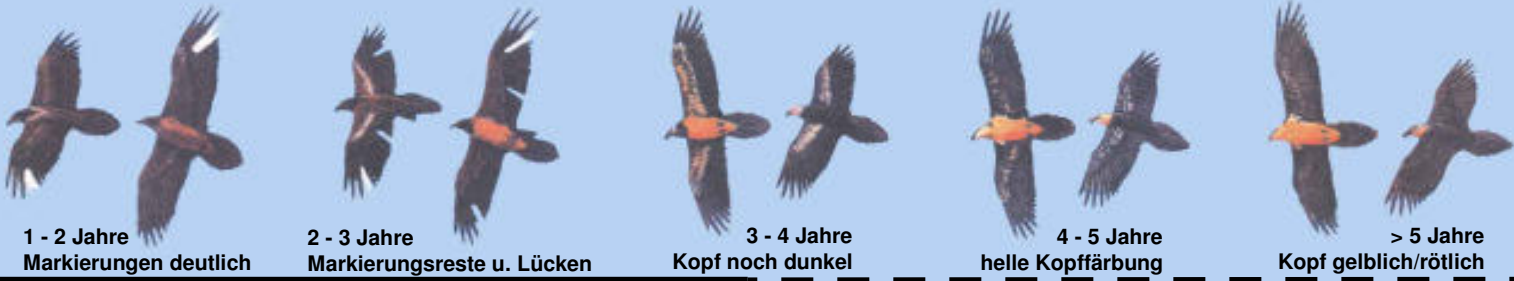
1 - 2 Jahre Markierungen deutlich

Grafiken: El Quebrantahuesos en los Pireneos (R. Heredia y B. Heredia); Ministerio de Agricultura Pesca y Alimentación. Publicaciones del Instituto Nacional para la Conservación de la Naturaleza, 1991