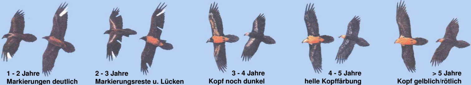
1 - 2 Jahre Markierungen deutlich

Grafiken: El Quebrantahuesos en los Pireneos (R. Heredia y B. Heredia); Ministerio de Agricultura Pesca y Alimentación. Publicaciones del Instituto Nacional para la Conservación de la Naturaleza, 1991