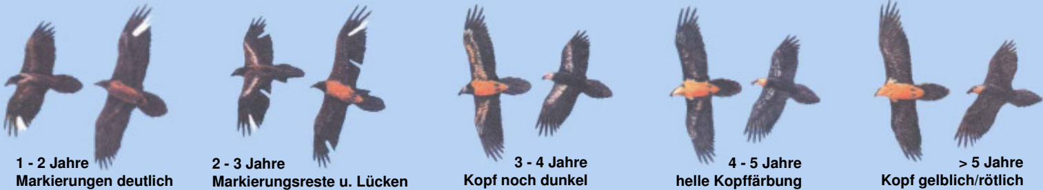
1 - 2 Jahre Markierungen deutlich

Grafiken: El Quebrantahuesos en los Pireneos (R. Heredia y B. Heredia); Ministerio de Agricultura Pesca y Alimentación. Publicaciones del Instituto Nacional para la Conservación de la Naturaleza, 1991