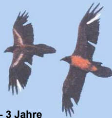
2 - 3 Jahre Markierungsreste u. Lücken