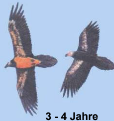
3 - 4 Jahre Kopf noch dunkel