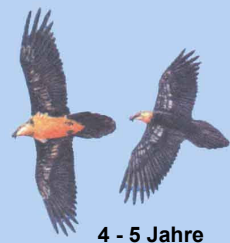
4 - 5 Jahre helle Kopffärbung