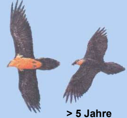
> 5 Jahre Kopf gelblich/rötlich

Die Wiederansiedlung des Bartgeiers wird aus dem EU-Förderprogramm Ländliche Entwicklung der Maßnahme Nationalpark gefördert.