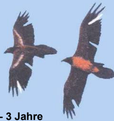
2 - 3 Jahre Markierungsreste u. Lücken