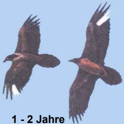
1 - 2 Jahre Markierungen deutlich

Grafiken: El Quebrantahuesos en los Pireneos (R. Heredia y B. Heredia); Ministerio de Agricultura Pesca y Alimentación. Publicaciones del Instituto Nacional para la Conservación de la Naturaleza, 1991