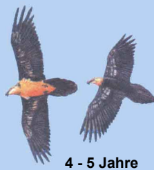
4 - 5 Jahre helle Kopffärbung