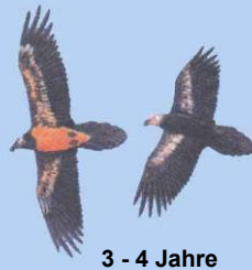
3 - 4 Jahre Kopf noch dunkel