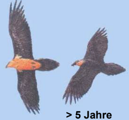
> 5 Jahre Kopf gelblich/rötlich

Die Wiederansiedlung des Bartgeiers wird aus dem EU-Förderprogramm Ländliche Entwicklung der Maßnahme Nationalpark gefördert.