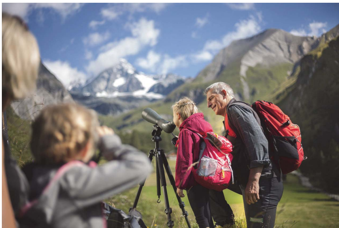
Foto: Nationalpark Ranger/-innen setzen einen großen Teil der Bildungsarbeit um (M. Lugger).

( https://hohetauern.at/besuchen/unsere-ranger ).