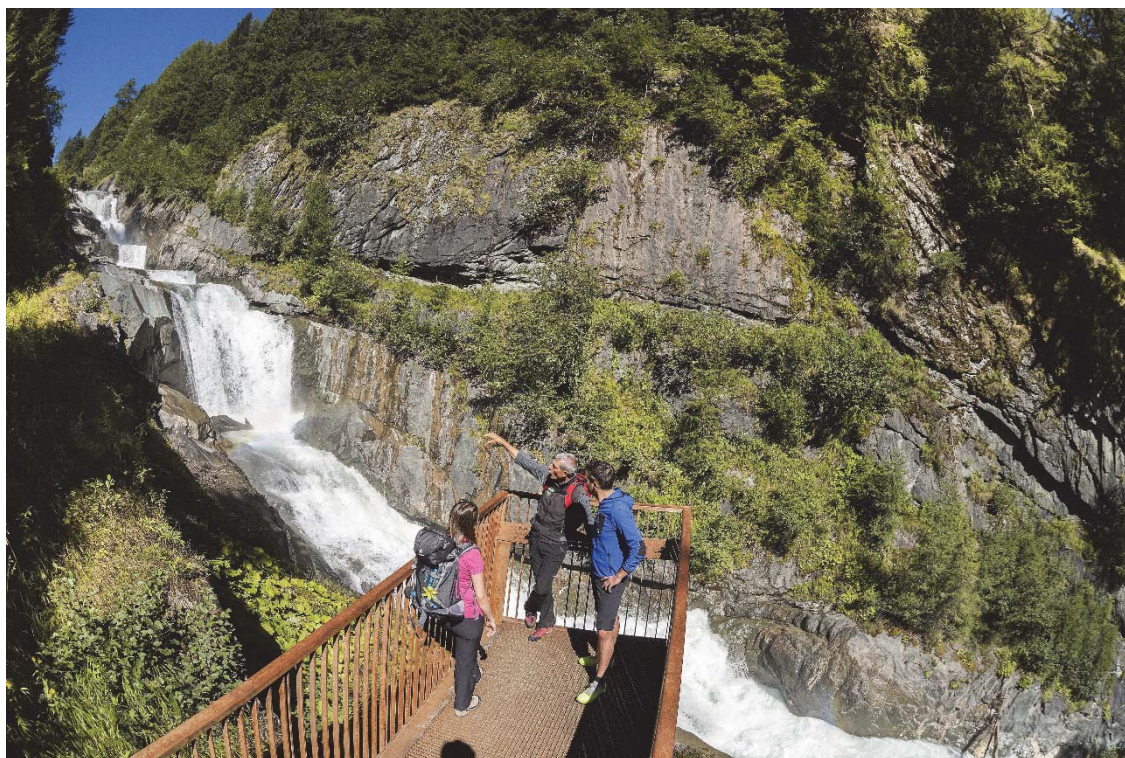
Foto: Themenwege bieten Wissen und ermöglichen Besucherlenkung (M. Lugger).