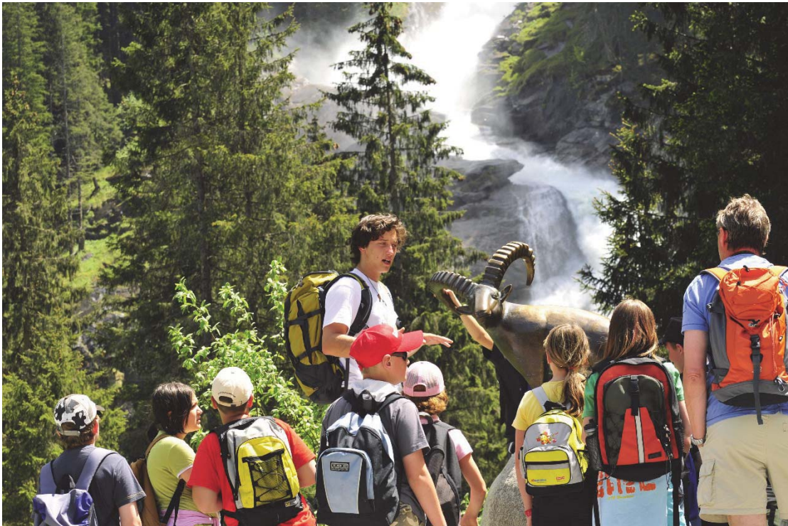
Foto: Die Natur als Klassenzimmer und die Ranger/-innen als Lehrperson (F. Rieder).

Die Schüler/-innen wissen nach ihrem Aufenthalt im Nationalpark über die „Nationalparkidee“ und den Schutzgedanken Bescheid. Des Weiteren können die Schüler/-innen über die Bedeutung und Aufgaben eines Schutzgebietes wie dem Nationalpark Hohe Tauern altersgemäß Auskunft geben.