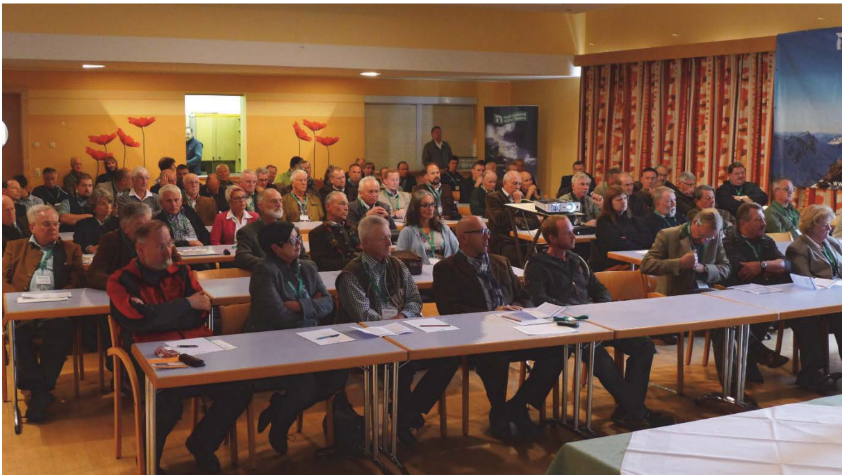
Foto: Vorträge, Workshops und Exkursionen finden über die Nationalpark Akademie statt (H. Mattersberger).

Das jährlich neu gestaltete Programm der Akademie ist zu finden unter: https://hohetauern.at/de/bildung/nationalpark-akademie