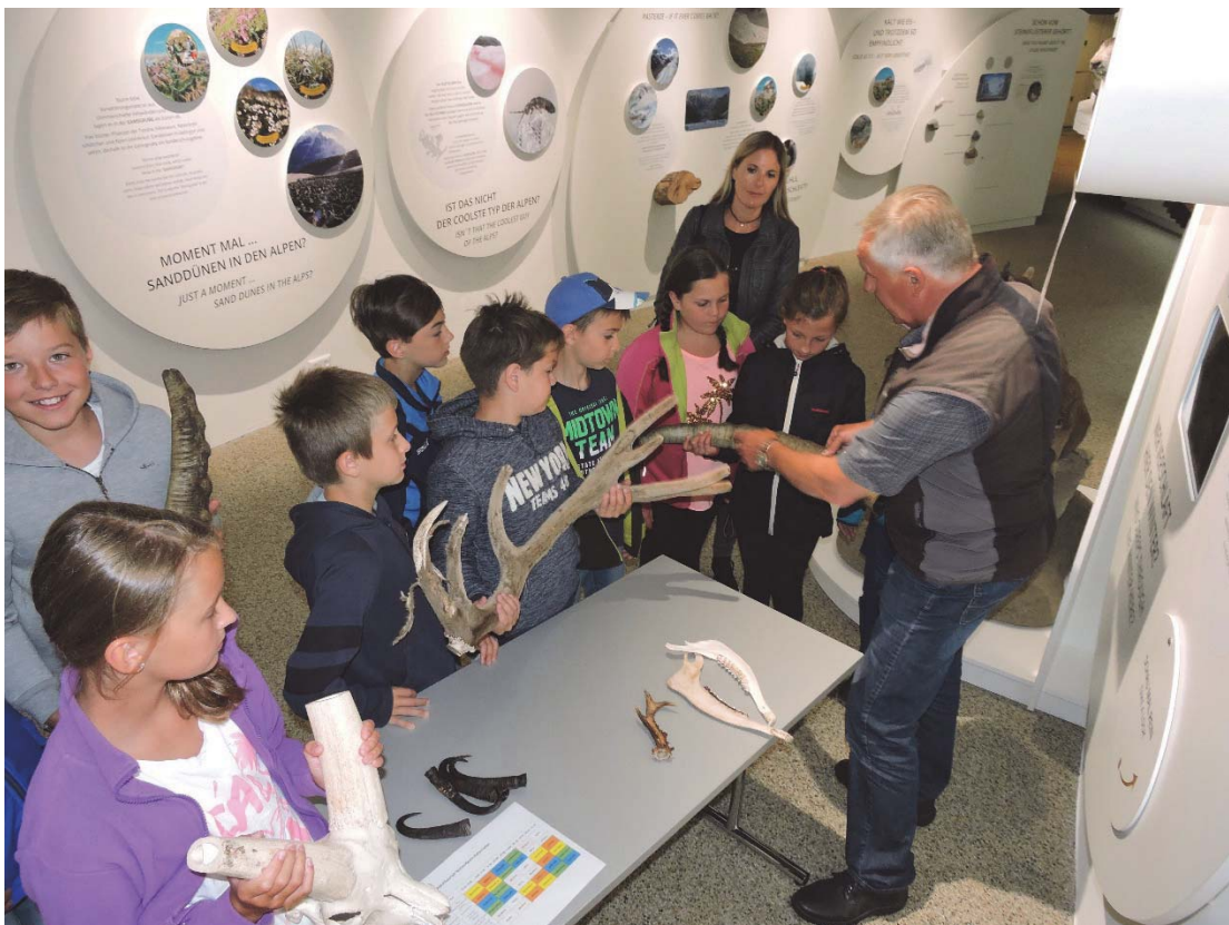
Foto: Schüler/-innen lernen aus erster Hand vom Ranger (E. Hasslacher).

Durchgängig verfolgen die Nationalparkverwaltungen mit diesen Schulpartnerschaften das Ziel, dass jedes Kind aus der Nationalparkregion während seiner schulischen Ausbildungszeit zu den unterschiedlichen Themen gemäß den Lehrplänen aktiv in Kontakt mit dem Nationalpark Hohe Tauern kommt.