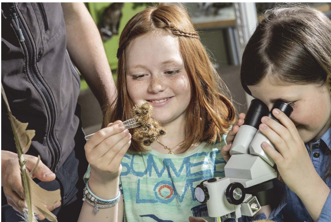
Foto: Die Bionik ist ein besonders spannendes Thema im „rangerlab“ (H. Fessl).

Die „rangerlabs“ sind eingebettet im Besucherzentrum Mallnitz, welches das Bildungszentrum des Nationalparks Hohe Tauern Kärnten darstellt. Die „rangerlabs“ sind Forscherwerkstätten in denen zusammen mit Nationalpark Ranger/-innen geforscht, experimentiert und ausprobiert wird. Sie stehen gänzlich unter dem Motto „von der Natur lernen“. Ziel ist, dass die Teilnehmer/-innen eigene Ideen und Lösungsvorschläge entwickeln können und das Gelernte hautnah erlebt wird. Dies wird durch die Kombination aus Indoor- und Outdoor-Programm direkt im Schutzgebiet ermöglicht. Das didaktische Prinzip orientiert sich am forschenden und entdeckenden Lernen.