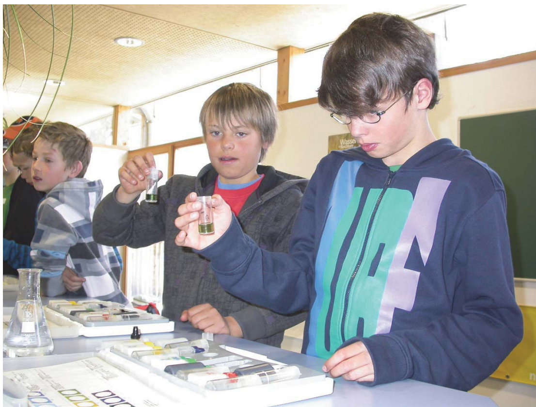
Foto: Laborarbeit folgt auf Feldarbeit im Haus des Wassers (Archiv).

Im Umweltbildungszentrum auf 1.440 Meter Seehöhe im Osttiroler Defereggental forschen und lernen die Besucher/-innen gemeinsam mit Nationalpark Ranger/-innen. Wasser hat im Nationalpark Hohe Tauern seit jeher eine herausragende Bedeutung und ist zudem Grundlage unseres Lebens. Daher liegt der Fokus der Umweltbildung im Haus des Wassers auf der Vermittlung eines nachhaltigen Verständnisses der Zusammenhänge von Wasser und Klima. Die Schulgruppen halten sich jeweils für mehrere Tage im angeschlossenen Beherbergungsbetrieb auf und somit kann auch ein gemeinschaftliches Erlebnis geboten werden.