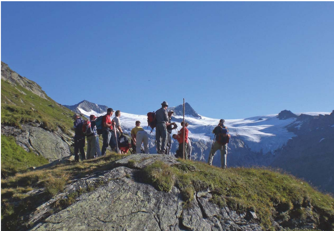
Foto: Ein abwechslungsreiches Exkursionsangebot für Erwachsene.

Ziel der Nationalparkidee ist unter anderem einem möglichst großen Kreis von Menschen ein eindrucksvolles Naturerlebnis zu ermöglichen. Dies entspricht den Guidelines for Applying Protected Area Management Categories der IUCN, wonach Nationalparks der Kategorie II neben dem großflächigen Schutz von Natur auch der geistig-seelischen Erbauung, Forschung, Bildung und Erholung dienen sollen. Jährlich werden spannende Sommer- und Winterprogramme für alle Einheimischen und Gästen in den Nationalparkregionen angeboten. Dies erfolgt unter fachkundiger Leitung der Nationalpark Ranger/-innen.