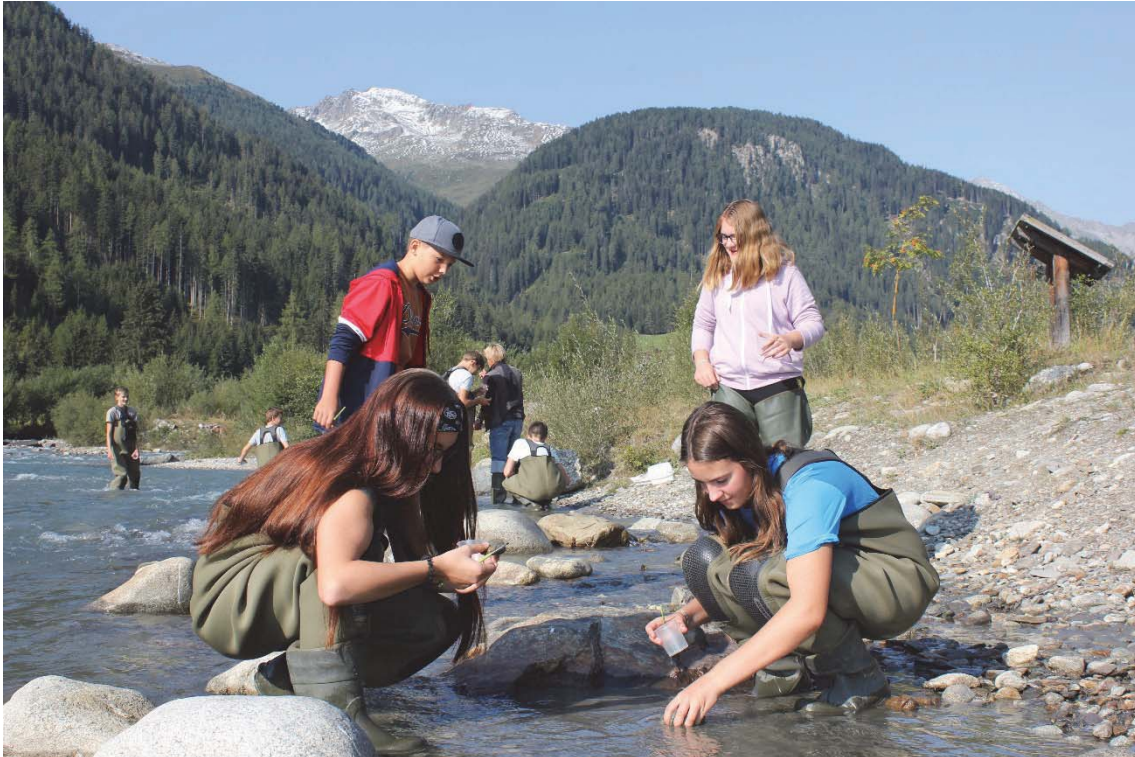
Foto: Wasser ist eines der Themen in den Camps des Nationalparks (Archiv).

Zusammenhalt und gegenseitige Unterstützung sind die Eckpfeiler der Tage im Schutzgebiet.