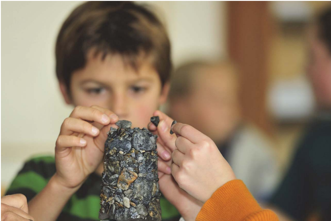
Foto: Hausbau für die Köcherfliegenlarve im Science Center (Archiv).

Teilnehmenden dem Leben und Klima im Hochgebirge oder der Geologie des Tauernfensters.