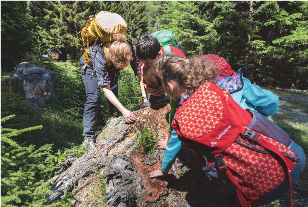
Foto: der Natur auf der Spur sind die Umweltspürnasen (H. Assil).