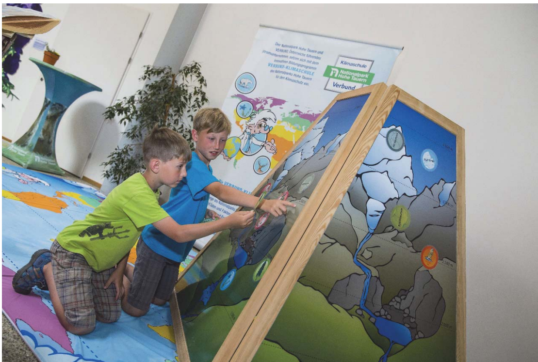
Foto: Die Wanderausstellungen wandern von Schule zu Schule und machen Spaß.

Der Nationalpark Hohe Tauern unterstützt Lehrer/-innen der mittleren und höheren Schulen mit Unterrichtsmaterialien. Die didaktisch gut aufbereiteten Unterlagen sind wertvolle Ergänzungen in den Fächern Biologie und Umweltkunde, Geographie und Wirtschaftskunde sowie Geschichte und Sozialkunde. Der umfangreiche Wissensteil wird durch Arbeitsblätter und Präsentationsfolien ergänzt.