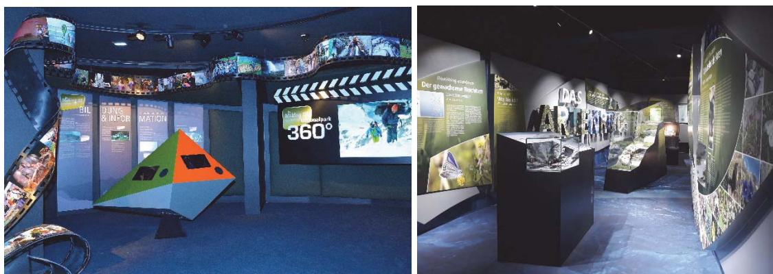
Foto: Ausstellungen werden stets auf modernstem technischen und didaktischen Niveau umgesetzt.

Nationalpark Ausstellungen finden sich mittlerweile in vielen Nationalpark Gemeinden. In diesen inhaltlich wie didaktisch sehr anspruchsvollen und aufwändig gestalteten Indoor-Erlebnis-Einrichtungen werden Themen und Phänomene vor allem zur Natur, aber auch zur Kultur des Nationalparks Hohe Tauern inszeniert.