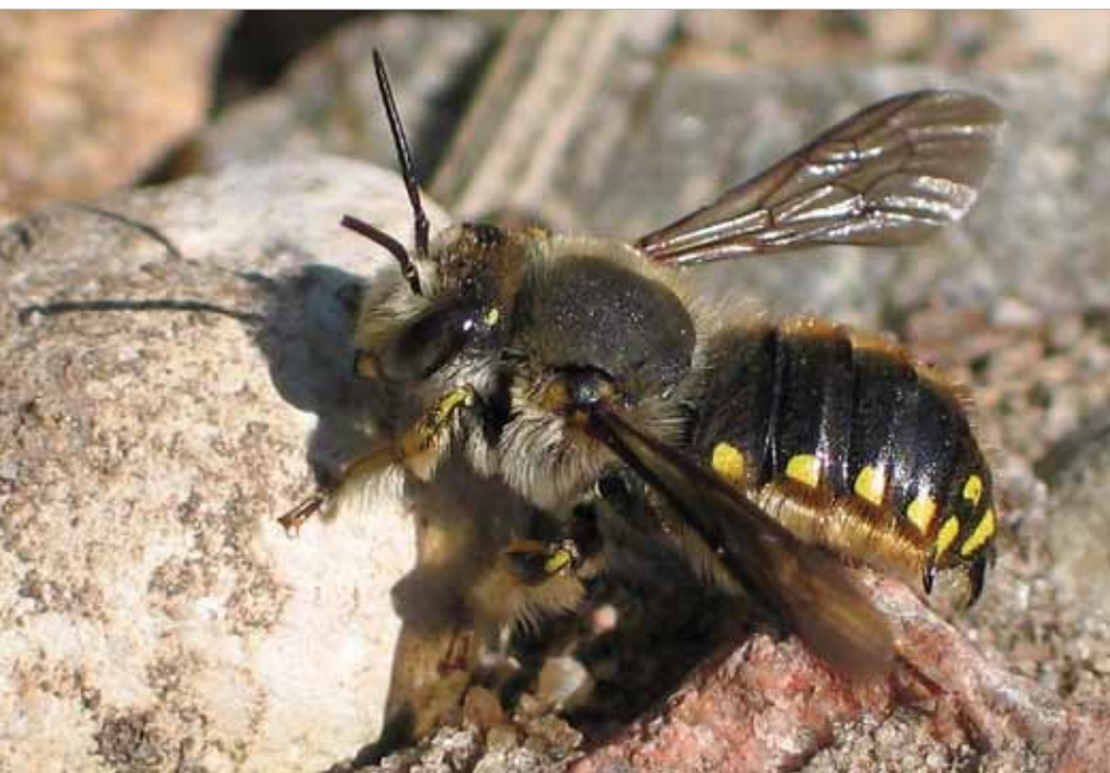
■ Garten-Wollbiene ( Anthidium manicatum )

Um einen möglichst hohen Artenreichtum zu erhalten bzw. zu fördern, wurde gemeinsam mit den Bürgermeistern als Gemeindevertreter, den Mitarbeitern der Bauhöfe und der Landesstraßenverwaltung sowie mit Landschaftspflegern ein Managementplan ausgearbeitet, der verstärkt ökologische Aspekte berücksichtigt, ohne dabei die Anforderungen an die Verkehrssicherheit zu vernachlässigen. Ganz nebenbei