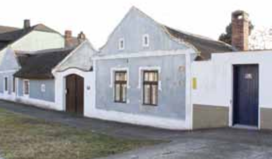
■ St. Andrä am Zicksee: einfacher Streckhof und Zwerchhof

Die Anlage der Bauernhöfe entsprach einem gleichbleibenden Muster. Entlang einer Grenze der Hofparzelle wurden die Gebäude hintereinander aufgereiht. Der meist dreiräumige Wohntrakt mit Vorderstube, Küche, Hinterstube (oder Kammer bei einfacheren Höfen) war mit dem Giebel zur Straße bzw. zum Anger orientiert. Die Wirtschaftsgebäude, wie die Fruchtkammer zur Lagerung von Vorräten und Gerätschaften, die Stallungen und Schuppen wurden direkt an den Wohnbereich angebaut. Den Abschluss bildete der Stadel. Diese Anordnung