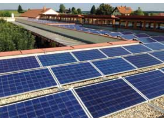
■ Photovoltaikanlage in Strem