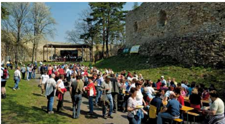
■ oben: Sternwanderung zur Ruine Landsee

Naturpark Landseer Berge Kirchenplatz 6 7341 Markt St. Martin T + 43 (0) 2618 5211-8; F -9 info@landseer-berge.at www.landseer-berge.at