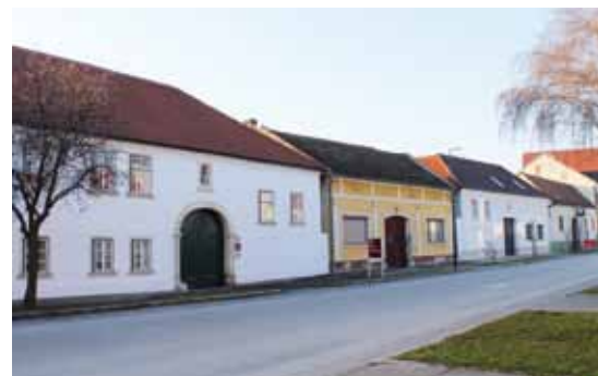
■ Winden: Vierseithöfe

So entstand rund um den See eine Vielfalt unterschiedlicher