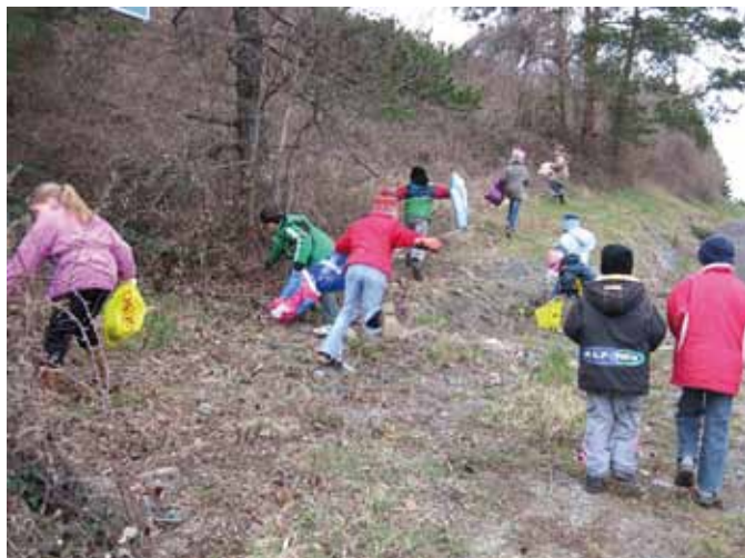
■ links: Jugendliche der Hauptschule Purbach helfen mit, die Umwelt sauber zu halten