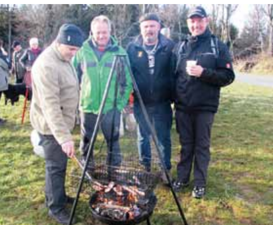
■ oben: Beim ORF-„Gipfeltreffen“ am Geschriebenstein

Im Laufe des Projekts wurden eine neue Homepage ( www.naturpark-geschriebenstein.at ) gestaltet, ein Fotowettbewerb durchgeführt, ein Naturpark-Memory, sechs Naturparkmagazine, Naturparkkalender und ein Naturparkhandbuch produziert. Weiters wurden Richtlinien für die Ernennung zu naturparkfreundlichen Betrieben ausgearbeitet. Inzwischen wurden elf Betriebe