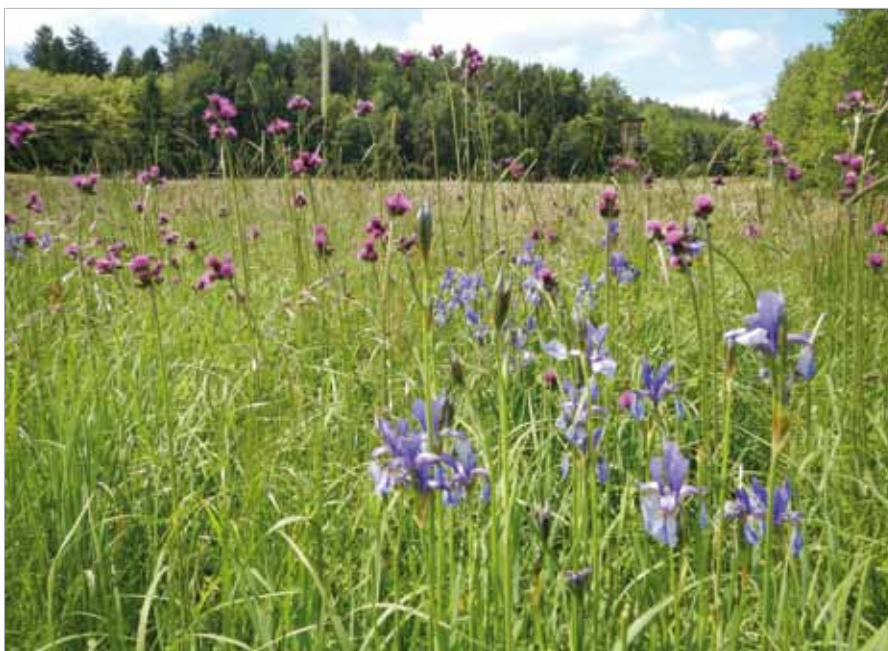
■ Feuchtwiese mit Bachkratzdistel und Sibirischer Schwertlilie

Insgesamt wurden bei den zoologischen Kartierungen 48 Tagfalterarten mit 547 Individuen registriert. Die am häufigsten festgestellten Arten waren: Großes Ochsenauge, Wachtelweizen-Schneckenfalter, Senf-Weißlinge (Artenpaar Leptidea sinapis/juvernica ), Rotbraunes Wiesenvögelchen, Landkärtchen, Grünader-Weißling, Schwarzer Apollofalter und Kleines Wiesenvögelchen. 18 Arten wurden überhaupt nur in einem einzigen Exemplar beobachtet, darunter acht Arten der Roten Listen. Zusätzlich wurden zehn Libellenarten registriert, die in zumindest einer der beiden Roten Listen (Burgenland, Österreich)