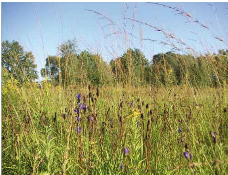
■ Pfeifengraswiese mit Lungen-Enzian

Die Durchführung der Erstpflegemaßnahmen erfolgte in Zusammenarbeit mit einem erfahrenen Landschaftspfleger. Diese umfassten die Entfernung von Gebüschen, das Mulchen von Gehölzstöcken, Häckseln von Hochstauden, wie Goldrute oder Brennessel, sowie Pflegemahden.