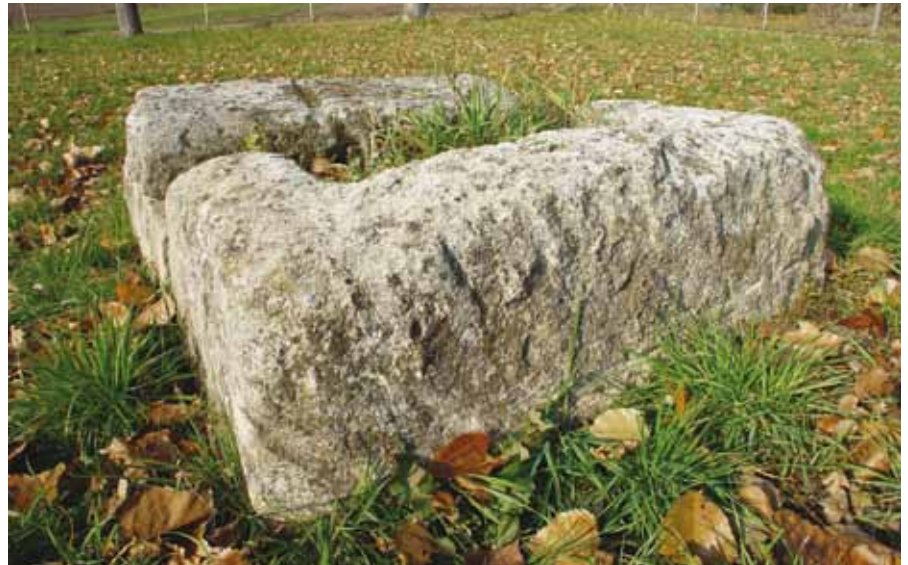
■ Historischer Quellstein der Quelle in Winden

Beim Wasserleitungsverband Nördliches Burgenland werden derzeit 45 Brunnen und Quellen für die Wasserversorgung genutzt, wobei sich die wichtigsten Brunnenanlagen im Randbereich der Mitterndorfer Senke, dem größten Grundwasservorkommen Mitteleuropas befinden. Von maßgeblicher Bedeutung sind hierbei die beiden Horizontalfilterbrunnenanlagen in Neudörfel, die Konsensmengen (Maß für die bewilligte Wasserentnahme) von 400 l/s und 200 l/s aufweisen. Die anderen Wassererschließungen teilen