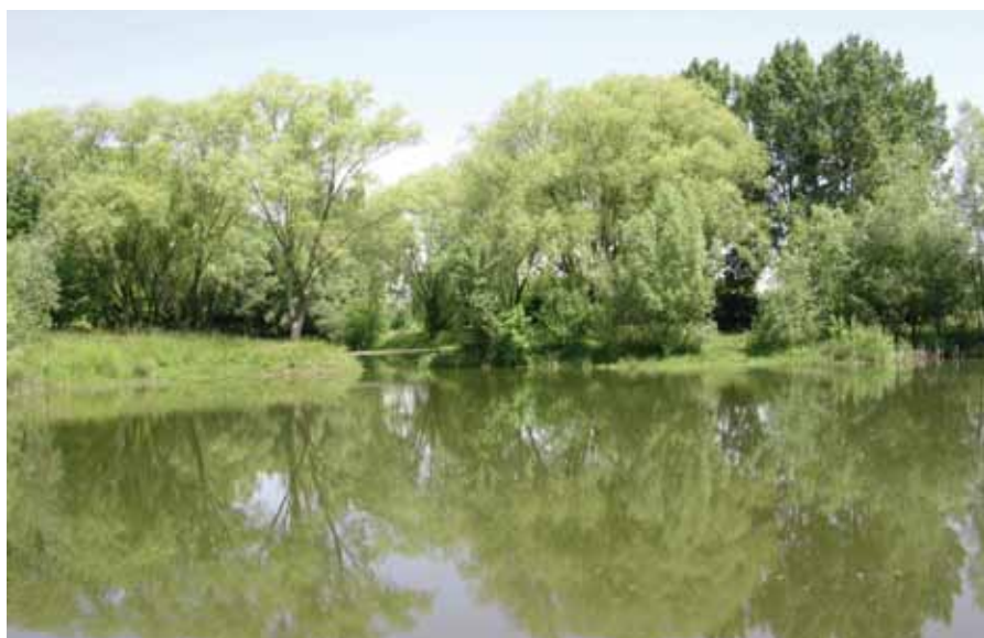
■ Rückhaltebecken bei Zurndorf und Antau (rechts)

Der naturschutzfachliche Wert der etwa 150 Rückhaltebecken des Burgenlands ist sehr unterschiedlich: Einige zeigen eine hohe Artenvielfalt an Pflanzen und Tieren, die auch in der Fauna-Flora-Habitat-Richtlinie der EU angeführt sind. Andere erfüllen diese Bedingungen nicht, bieten aber ein hohes Potenzial für verbessernde Maßnahmen. Studien zeigen, dass durch eine geschickte Renaturierung von künstlichen Gewässern das ökologische Gefüge und die Artenvielfalt entscheidend verbessert und der Arbeitsaufwand für Pflege und Beckenerhaltung minimiert werden können: Mit standortgerech-