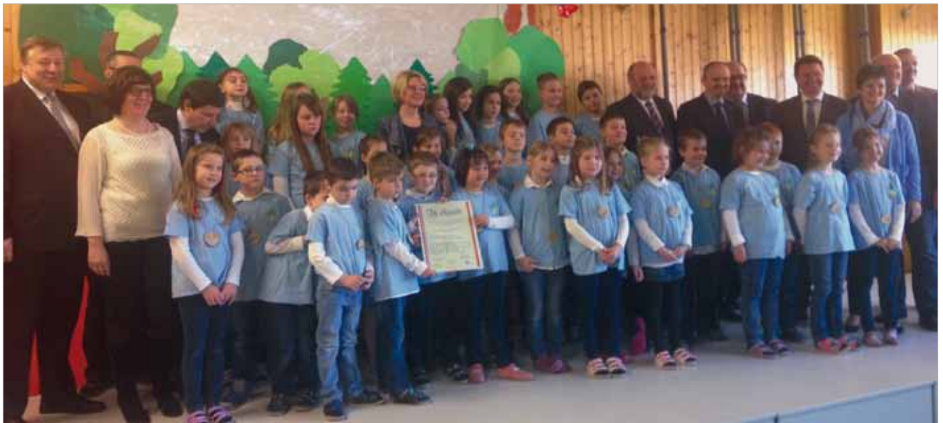
■ oben: Verleihung der Urkunde an die nunmehrige Naturpark-Volksschule Landseer Berge in Markt St. Martin

Drei Schulen im Naturpark Landseer Berge haben bisher alle notwendigen Kriterien erfüllt, um mit dem Prädikat „Österreichische Naturparkschule“ ausgezeichnet zu werden. Das Prädikat erhalten jene Schulen der Naturpark-Gemeinden, die ihr Leitbild an die vier Aufgabensäulen eines Naturparks – Schutz, Erholung, Bildung und Regionalentwicklung – anpassen und unter Berücksichtigung der Besonderheiten ihres Naturparks gemeinsame Lehr- und Lernziele definieren.