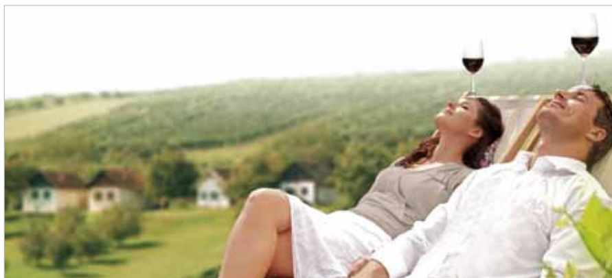
■ oben: Weinfrühling Südburgenland – von 1. bis 3. Mai 2015

Von 1. bis 3. Mai 2015 veranstalten Südburgenlands Winzer den Weinfrühling Südburgenland als einen der kulinarischen Schwerpunkte im Veranstaltungsreigen der Region. Bei der größten Weinveranstaltung im Südburgenland stehen die feinen Tropfen der südburgenländischen Winzer im Mittelpunkt.