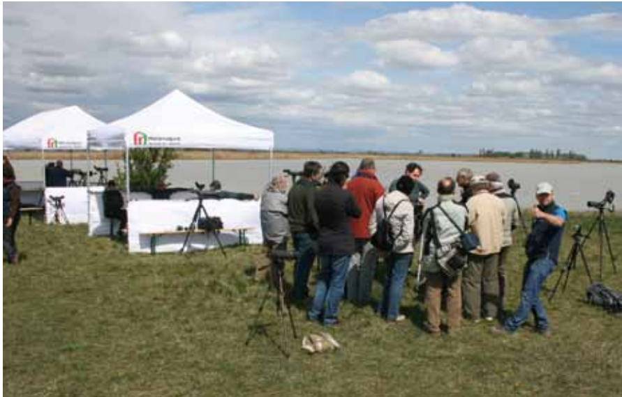
■ BEX Testzelte und aufmerksame Birdwatcher