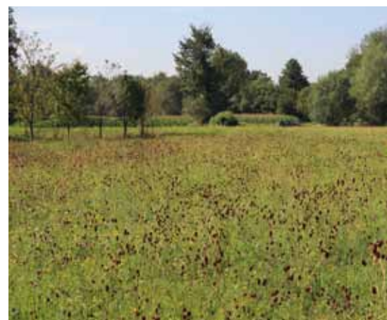
■ Weibchens des Eschen-Scheckenfalters (li.); der Weißdolch-Bläuling (Mitte) ist durch den namensgebenden weißen Streifen auf der Unterseite der Hinterflügel unverkennbar; re: in den Sommermonaten ungemähte Feuchtwiesen mit reichlich Großem Wiesenknopf werden bevorzugt von Wiesenknopf-Ameisen-Bläulingen besiedelt.