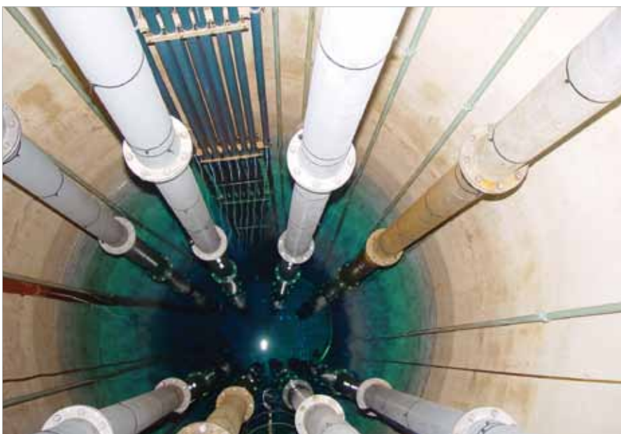
■ Brunnen des WLW Nördliches Burgenland

Besondere Bedeutung für die Wasserversorgung kommt den zumeist in größeren Tiefen vorkommenden (oft auch viele hunderte Meter), durch dichte Deckschichten gut geschützten Tiefengrundwässern zu. Weltweit werden Tiefengrundwasservorkommen für Zwecke der Trinkwasserversorgung, der Mineralwassergewinnung, für balneologische Zwecke (Heil- und Thermalwässer), wie auch für die Energiegewinnung