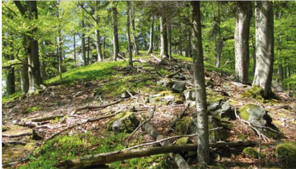
■ oben und unten: Außer Nutzung gestellte Waldflächen

Mitte März 2015 wurde die Broschüre „Waldumweltprogramm Burgenland“ präsentiert. Die dokumentierte Außer-nutzungsstellung von 1.265 Altbäumen und 337 ha Wald wurde im Rahmen von Forstförderprogrammen der Jahre 2008 – 2014 des Amts der Bgld. LReg, Abt. 4b, gefördert.