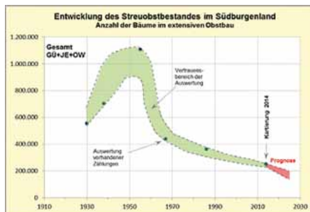
■ rechts: Grafische Darstellung der Entwicklung der Streuobstbestände

Streuobstbau besonders kleinteilig, entsprechend der Besitzstruktur in den Weinbaurieden.