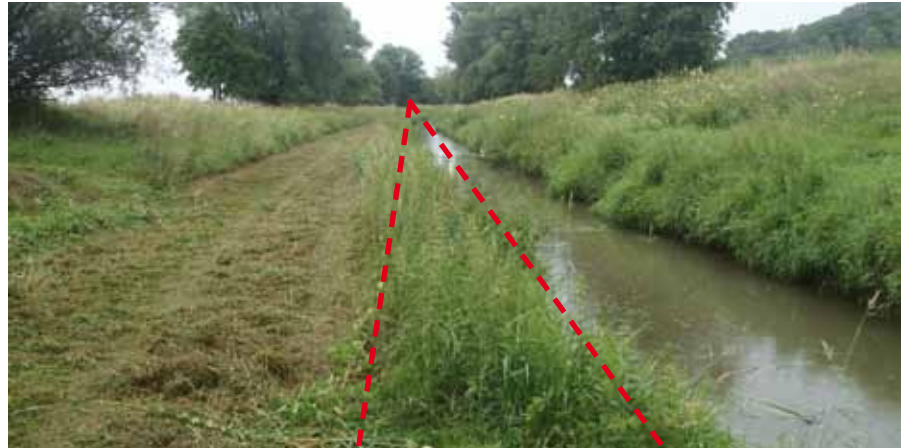
■ Der Krautstreifen direkt am Gewässer bleibt länger stehen und wird erst beim zweiten Durchgang gemäht bzw. gemulcht.

Ein Kompromiss, der ökologische Verbesserungen bringt und trotzdem Pflegekosten spart: Bei der ersten Pflege wird ein bis zu 2 m breiter Streifen an der Wasserlinie belassen und dient so als Rückzugsraum für viele Tierarten. Dieser Streifen wird erst beim