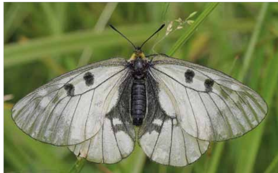
■ Schwarzer Apollo