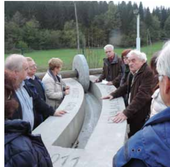
■ Besuch des Gottscheer Altsiedler-Vereins

Sehenswert sind vor allem der Bischofspalast, die Burg (Slowenische Akropolis), der Dom und der zentrale Preseren-Platz, mit Jugendstilhäusern und einer Dreibrückenanlage. Ljubljana ähnelt einerseits einer österreichischen Stadt, hat aber durch seine Altstadt, durch die vielen Cafés am Fluss und das gemäßigte Klima mediterranes Flair.