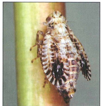
Abb. 2: Der Nachweis von Trypetimorpha occidentalis aus Podersdorf stellt den ersten Nachweis für das Burgenland dar. – Fig. 2: The record of Trypetimorpha occidentalis in Podersdorf is the first from Burgenland.