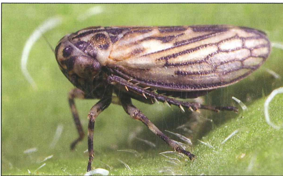
Abb. 1: Anaceratagallia ribauti ist die häufigste Art im Randbereich der Lacken. – Fig. 1: Anaceratagallia ribauti ist the most common leafhopper of the border areas of the salt lakes.

Errastunus ocellaris (FALLÉN, 1806) E -B1 (Falle 2), 20. 5. 2001: 1 M 1 Lv.; E -B1 (Falle 3), 3. 6. 2001: 1 W; E -U1 (Falle 2), 18. 6. 2001: 1 M 1 W; E -U3 (Falle 2), 20. 10. 2001: 1 W; E -U3 (Falle 4), 5. 8. 2001: 2 Lv.; E -U3 (Falle 5), 19. 8. 2001: 1 M; E -U3 (Falle 5), 6. 9. 2001: 1 M 1 W; P -U1 (Falle 2), 20. 5. 2001: 1 M 1 Lv.; ZS-U2 (Falle 1), 20. 5. 2001: 1 W 1 Lv.; ZS-U2 (Falle 1), 23. 8. 2001: 1 M; ZS-U2 (Falle 1), 4. 5. 2001: 1 Lv.; ZS-U2 (Falle 2), 4. 5. 2001: 1 Lv.; ZS-U2 (Falle 2), 7. 9. 2001: 1 W 3 Lv.; ZS-U2 (Falle 3), 20. 10. 2001: 1 W; ZS-U2 (Falle 3), 5. 8. 2001: 1 Lv.