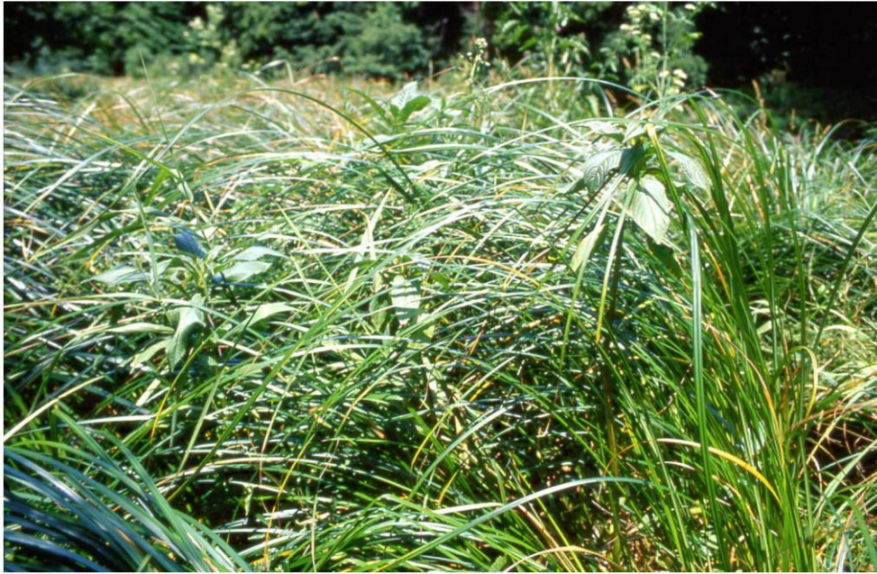
Foto 3: Dichtes Caricetum buekii mit einzelnen Impatiens glandulifera -Pflanzen an der Thaya (Bestand E 7) (Aufnahme: F. Essl; Juli 2001)