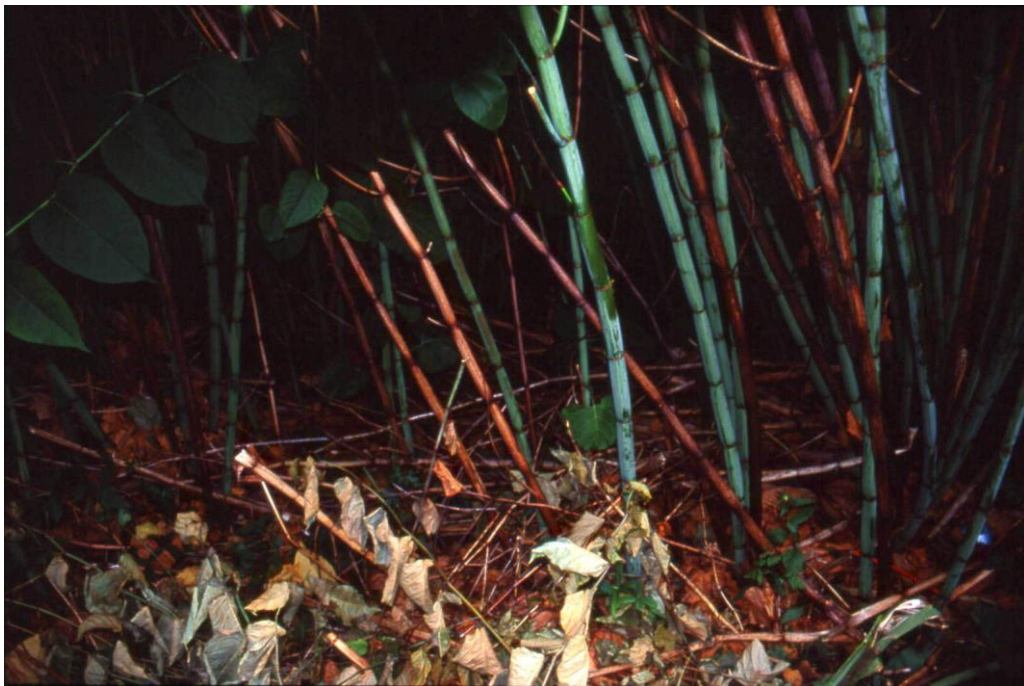
Foto 1: Blick in einen dichten Fallopia japonica -Bestand (Bestand E2) mit fehlender Begleitvegetation (Aufnahme: F. Essl; Juli 2001).

Die Artenzahl der Aufnahmen schwankt zwischen 5 und 10.