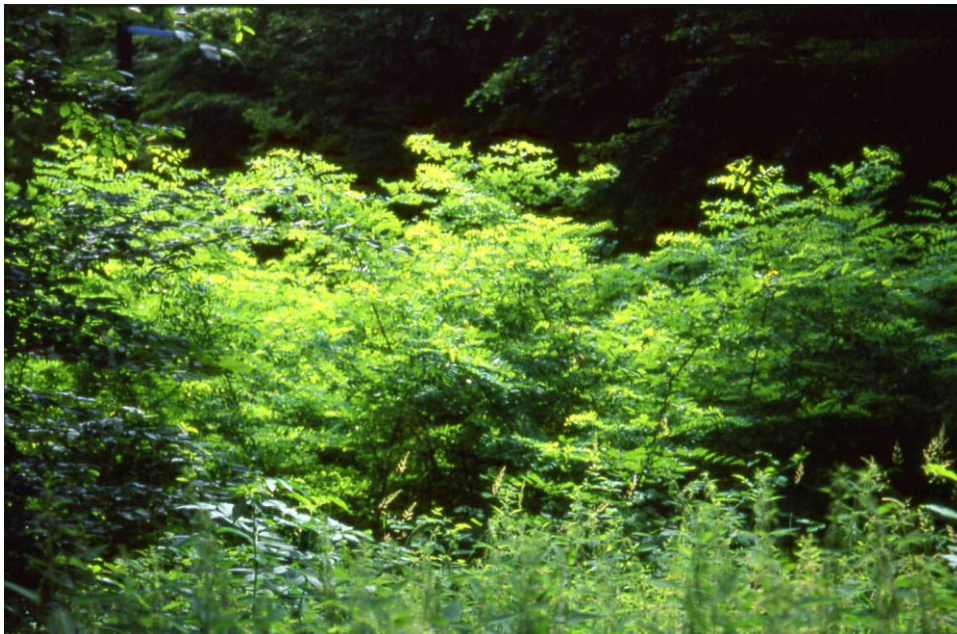
Foto 2: Dichter Bestand junger Robinien nördlich vom Schloss Karlslust (Bestand E 25), die unterhalb einer Leitungsstrasse verstärkt aufkommen (Aufnahme: F. Essl; Juli 2001).

Die Artenzahlen der aufgenommenen Bestände ist gering bis sehr gering (8 bis 21 Arten).