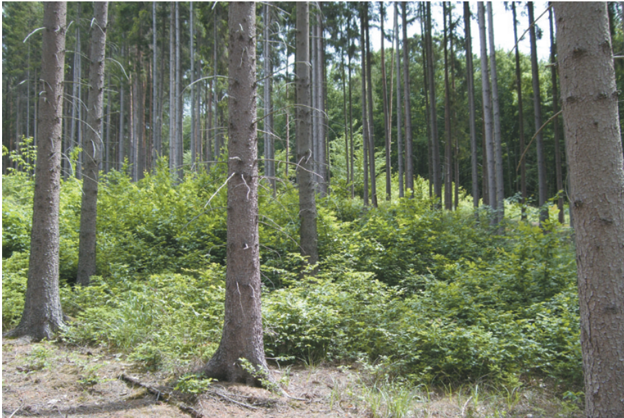
Abb. 4: Laubholzverjüngung unter Fichtenschirm

In Beständen mit heimisch standortgerechten Baumarten wie Rotbuche ( Fagus sylvatica ), Weißbuche ( Carpinus betulus ), Linde ( Tilia spp.), Ulme ( Ulmus spp.), Erle ( Alnus glutinosa ), Ahorn ( Acer spp.) und Nadelholz wie Eibe ( Taxus baccata ) und Tanne ( Abies alba ) erfolgen keine forstlichen Eingriffe mehr. In jenen Beständen die mit heimischen aber nicht standortgerechten Bäumen wie Fichte ( Picea abies ), Lärche ( Larix decidua ) Weiß- und Schwarzkiefer ( Pinus sylvestris , Pinus nigra ) bestockt sind werden Umwandlungsmaßnahmen nach folgenden Kriterien getätigt. In jenen Beständen wo Laubholz beigemischt ist, erfolgt im ersten Schritt eine starke Stammzahlreduktion der Nadelhölzer, um das vorhandene Laubholz zu fördern. In weiteren Schritten wird das Nadelholz komplett entfernt. In gänzlich von Nadelholz bestockten Beständen, meist Dickungen und Stangenhölzer, wird mit starken Durchforstungseingriffen eine natürliche Laubholzverjüngung (Abb. 4) eingeleitet. Sobald die Laubholzverjüngung gesichert ist, wird der Nadelholzbestand geräumt. Die Erfahrung hat aber gezeigt, dass solche Flächen innerhalb weniger Jahre eine ausreichende Laubholzverjüngung (Abb. 5) aufweisen. Bäume mit fremdländischer Herkunft wie Douglasie ( Pseudotsuga menziesii ) und Robinie ( Robinia pseudacacia ) werden zur Gänze entfernt.