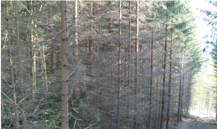
Abb. 3: Fichtendickung vor Einleitung einer Laubholzverjüngung

Weißkiefer ( Pinus sylvestris ) und Wachholder ( Juniperus communis ) auf Felsstandorten sowie Weißtanne ( Abies alba ) und Eibe ( Taxus baccata ) auf besseren Bonitäten sind autochthon. Die Nadelholzarten sind dem Laubholz beigemischt und bilden keine natürlichen Nadelholzreinbestände. Lediglich die Weißtanne ( Abies alba ) wäre in der Lage größere Gebiete zu bestocken bzw. mit der Rotbuche ( Fagus sylvatica ) flächendeckende Mischwälder zu gründen. Hohe Wildbestände, forstwirtschaftliches Desinteresse und das Tannensterben in den 80er und 90er Jahren des vorigen Jahrhunderts sind die Gründe warum die Tanne aus unseren Wäldern fast gänzlich verschwunden ist. Selbst in den naturnahen Thayawäldern gibt es nur noch wenige alte Tannenexemplare aber keine Jungbäume. Daher kann man von einer kleinen Sensation sprechen als vor zwei Jahren auf einigen Umwandlungsflächen junge Tannen entdeckt wurden. Die Rückkehr der Tanne ( Abies alba ) ist ein eindrucksvoller Beweis für Wald- und Wildmanagement der letzten Jahre.