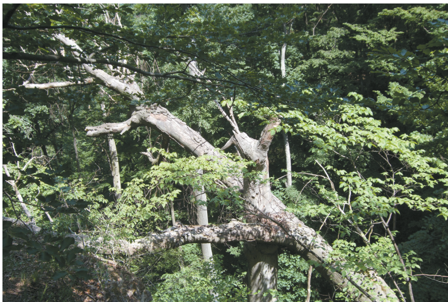
Abb. 6: „wilder Nationalparkwald“

eingesetzt. Diese Maschineneinsätze erfolgen ausschließlich bei Schneelage oder gefrorenen Boden. Der Abtransport (Rückung) des Holzes erfolgt mit speziellen Forstraktoren und Kranwägen. In Steillagen und unwegsamem Gebiet wurden eigene bestandsschonende Methoden entwickelt. Auf mehr als der Hälfte des Nationalparkwaldes erfolgen keine forstlichen Eingriffe mehr, auf diesen Flächen ist der Weg frei für Wildnis (Abb. 6).