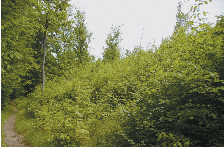
Abb. 5: Erfolgreiche Waldumwandlung nach Räumung des Fichtenbestande

Der Borkenkäfer ist grundsätzlich ein Sekundärschädling, der aber unter bestimmten Verhältnissen zur Massenvermehrung neigt und im Wirtschaftswald enorme Schäden verursachen kann. Aus diesem Grund wurde 2005 gemeinsam mit dem Bundesforschungs- und Ausbildungszentrum für Wald, Naturgefahren und Landschaft (BFW) ein flächendeckendes Borkenkäfermonitoring eingerichtet. Der Käferflug wird mittels detaillierten Klimawerten (Halbstundenwerten) den meteorologischen Bedingungen gegenüber gestellt. Im Mittelpunkt des Interesses steht hier die Abhängigkeit des Käferschwärmens vom Erreichen definierter Schwellentemperaturen bzw. erreichter Temperaturzeitsummen. Diese genaue Erfassung der klimatischen Bedingungen soll die Prognose für den lokalen Gefährdungsgrad der Waldbestände verbessern.