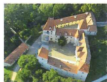
schloss ORTH nationalpark zentrum

Atraktivita: Revír európskej korytnačky močiarnej, plávajúci vodný mlyn pri brehu Dunaja, mŕtve ramená, dunajské ostrovy, plavba kompa na južný breh Dunaja.