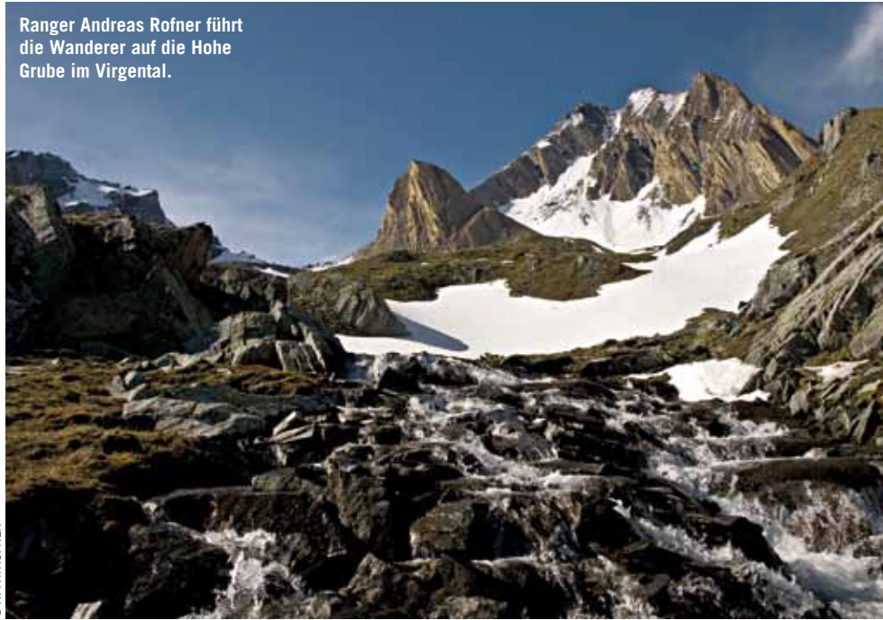
Ranger Andreas Rofner führt die Wanderer auf die Hohe Grube im Virgental.

Termin: jeweils Montag ab 23. Juni Treffpunkt: 14 Uhr Natur- & Bio Kinderhotel Benjamin, Brandstatt 30, Malta Preis: € 9,- für Erwachsene, € 6,- für Kinder bis 14 Jahre, inkl. Führung Kinder bis 5 Jahre gratis! Anmeldung: Tel.: 04733/362, www.nationalparkerlebnis.at