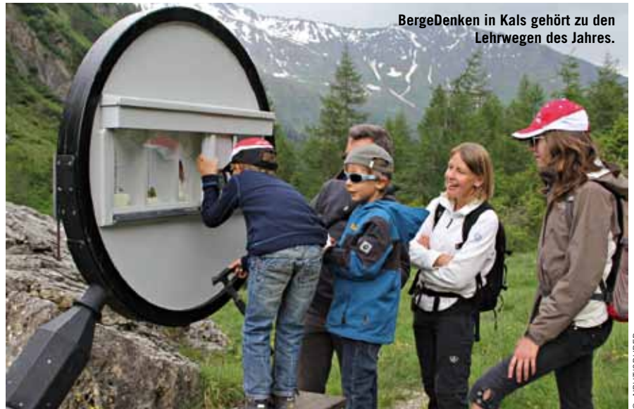
BergeDenken in Kals gehört zu den Lehrwegen des Jahres.

Die Öffnungszeiten orientierten sich an den Betriebszeiten der Bahn: www.gletscherwelt-weisse.at/de/sommer . Der Eintritt ist kostenlos.