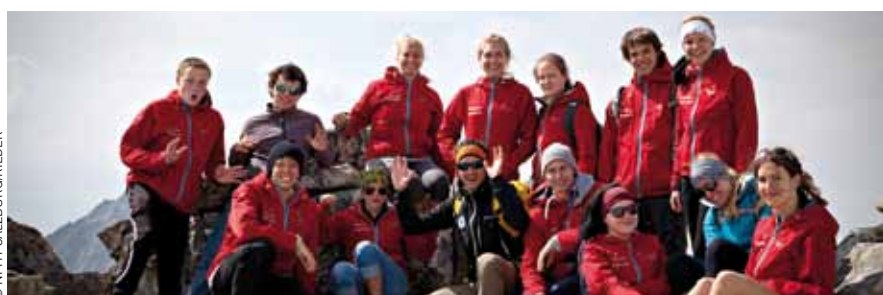
Der Ferienjob im Nationalpark Hohe Tauern Salzburg macht großen Spaß und erlaubt Einblicke in die Arbeit des Schutzgebiets.

Das BIOS Nationalparkzentrum ist das ideale Ausflugsziel für die ganze Familie: An zahlreichen interaktiven Stationen finden die kleinen und großen Besucher, Antworten auf die Frage „Was ist Leben, wie ist es entstanden und wo ist es zu finden?“ Im BIOS wird jeder Besucher zum Forscher und kann spielerisch erstaunliche Strukturen unter dem Mikroskop entdecken oder die Tierwelt eines echten Gebirgsbachs erforschen, der direkt durch die Ausstellung fließt. Auch für die jüngsten Gäste bietet das BIOS spannende Abenteuer. Der neue Kinderbereich bietet Platz zum Toben und Spielen. Das BIOS Nationalparkzentrum ist bis 5. Oktober täglich von 10 bis 18 Uhr geöffnet. www.hohetauern.at/bios