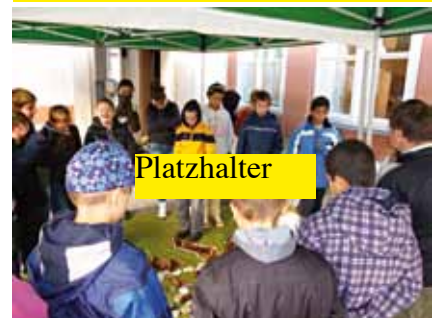
Fotos Schulfest als Platzhalter – aktuelle Fotos kommen am 13. Juni.