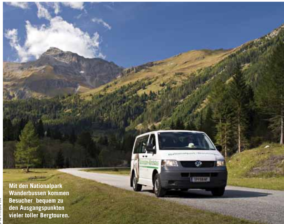
Mit den Nationalpark Wanderbussen kommen Besucher bequem zu den Ausgangspunkten vieler toller Bergtouren.

Ein Beispiel ist die Wildtierbeobachtung im Seebachtal: Bis 14. September geht es jeden Donnerstag mit einem Nationalpark Ranger zur Wildtierbeobachtung. Dabei kann man Rotwild, die größte Gamspopulation des National-