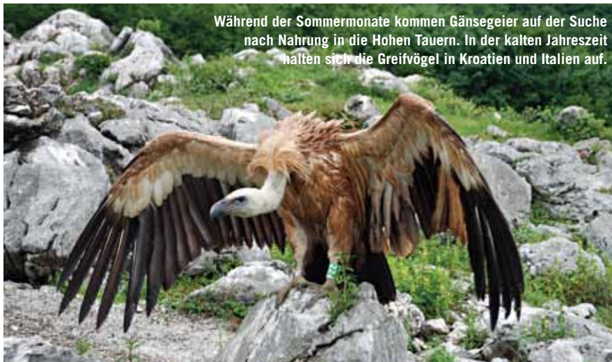
Während der Sommermonate kommen Gänsegeier auf der Suche nach Nahrung in die Hohen Tauern. In der kalten Jahreszeit halten sich die Greifvögel in Kroatien und Italien auf.