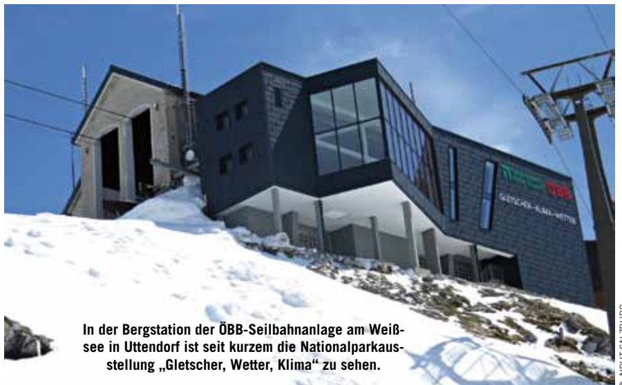
In der Bergstation der ÖBB-Seilbahnanlage am Weißsee in Uttendorf ist seit kurzem die Nationalparkausstellung „Gletscher, Wetter, Klima“ zu sehen.