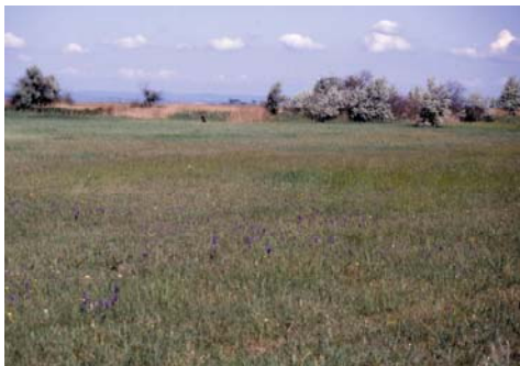
Wiesenlandschaft bei Neudegg

n=17). Die Wiesen südöstlich von Illmitz werden jährlich gemäht, auch hier werden Vegetationsstrukturen und totes Pflanzenmaterial sehr gründlich entfernt, wodurch Reptilien nur vereinzelt in kleinräumigen Randbereichen festgestellt werden konnten (Unterer Schrändlsee, 17. Mai: Lacerta agilis , n=4, Natrix natrix , n=1). Der Bereich „Darscho“, der äußerst intensiv von den Steppenrindern beweidet wird, zeigt noch weniger Habitatinventar für Reptilien. Hier wird der Mangel an Versteckmöglichkeiten durch versalzete und vegetationsarme Stellen noch verstärkt (17. Mai: Lacerta agilis , n=2).