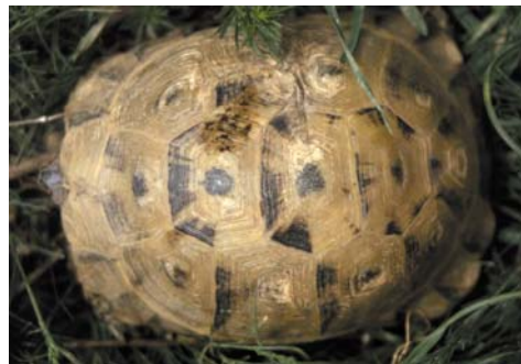
Dorsalansicht einer weiblichen Testudo ibera ; Fundort Mus (Osttürkei), FO 8, Mai 2000

In der südöstlichen Türkei fand ich Testudo ibera im Gebiet der Städte Sanliurfa (FO 13) und Dyarbakir (FO 14). Tiere westlich des Euphrat bei Gaziantep (FO 12), waren jenen aus der Provinz Hatay ( Testudo antakiensis ) sehr ähnlich, jene östlich des Flusses erinnern stark an jene, die ich im Gebiet der Stadt Mus fand.