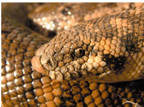
Westliche Sandboa

Ein ca. 60 cm langes Exemplar der Westlichen Sandboa ( Eryx jaculus turcicus ) konnte schließlich am letzten Tag unseres Aufenthaltes in der Nähe der Lagune Korission gefunden werden.