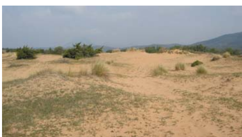
Dünenlandschaft bei der Lagune Korission

(s. TÓTH et al. (2002)), sowie Meldungen u. a. vom Pantokrator (KEYMAR, pers. Mittl.) gibt, ist die Erdkröte ( Bufo bufo spinosus ) auf Korfu weit verbreitet. Das Laichgeschehen war zu dieser Jahreszeit weitgehend abgeschlossen. Kaulquappen konnten in vielen Gewässertypen, wie in Teichen, Tümpeln, in wassergefüllten Gräben und langsam fließenden Bächen beobachtet werden, stellenweise syntop mit dem Teichmolch ( Triturus vulgaris graecus ).