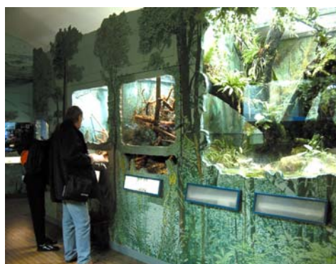
Terrarien im Untergeschoß des Naturhistorischen Museums Wien

reiche Tierhaltung sollte es doch etwas zu berichten geben und eine Tierhaltung zum Zweck der Erforschung von Reptilien und Amphibien ohne neue Beobachtungen und Erkenntnisse kann es eigentlich auch nicht geben. Das fachkundige Publikum der ÖGH weiß die Präsentation einer guten Tierhaltung sicher zu schätzen und Erfolge zu würdigen.