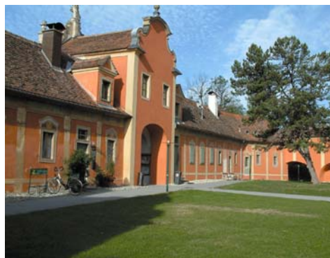
Schloss Pöllau