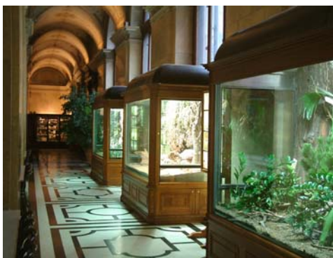
Terrarienanlagen in der Kuppelhalle des Naturhistorischen Museums Wien

Wichtiges Anliegen der Österreichischen Gesellschaft für Herpetologie ist es, ein Forum zu bieten, auf dem aktuelle Information über alles, was mit Reptilien und Amphibien in Zusammenhang steht, ausgetauscht wird. Die Palette der Themen umfaßt die Ankündigung von Vorträgen, Tagungen und Exkursionen, Berichte über aktuelle Forschungs- und Naturschutzprojekte, neue Beobachtungen aus der Terraristik, Gesetzesänderungen im Natur-, Arten- und Tierschutz sowie Literaturhinweise und ist in vielerlei Hinsicht erweiterbar.