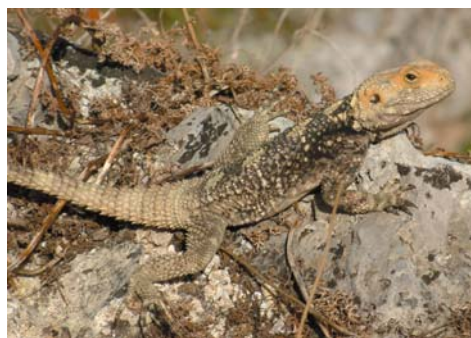
Weiblicher Hardun, Korfu Stadt

Der Hardun ( Laudakia stellio stellio ), sicherlich die bemerkenswerteste Echse dieser Insel, wird von TÓTH et al (2002) für die Gegend Kanoni - Korfu Stadt - Benitses am Ostufer genannt. Beobachtungen zeigten, dass sich diese Art gegenwärtig weiter nach Westen ausbreitet und mittlerweile ca. nur mehr 1,5 km Luftlinie von der Westküste (Raum Sinarades) entfernt ist. Dies ist als rezente Ausbreitung zu interpretieren.