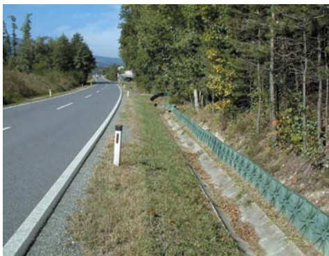
Permanenter Amphibienzaun an der L 406

Als nächster Schritt wurde eine permanente Amphibienschutzanlage errichtet, die abschnittsweise aus verschiedenen Materialien bestand. Zuführende Leiteinrichtungen und 17 Amphibiendurchlässe (Tunnels) waren aus verschiedenen Materialien sowohl in Form, als auch in Querschnittsgröße und Lauffläche unterschiedlich ausgeführt. Als Baumaterialien dienten Polyethylen, Polymerbeton, Stahlblech und Holz. Die Querschnitte waren von 530 cm 2 bis 6000 cm 2 groß.