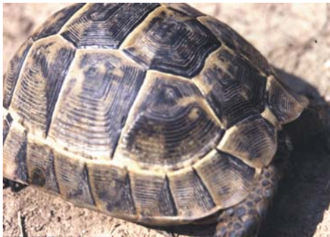
Sudadulte, weibliche Testudo ibera nahe der Ortschaft Mutki (Bitlis, Osttürkei), FO 7, Mai 1986

Am Südhang des Ararat, in der fast ebenen Steppenlandschaft nördlich der Stadt Dogubayazit (FO 10), waren die Tiere wieder sehr hochrückig und bis auf wenige Ausnahmen hell gefärbt.