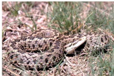
Vipera (ursinii) rakosiensis , Ungarn

tatstrukturen werden durch Grashorste mit trockenem Pflanzenmaterial gebildet, die thermisch begünstigte Versteckmöglichkeiten bieten (CORBETT et al. 1985). Diese Strukturen gehen jedoch durch die Mahd zumeist verloren. Durch die zu gründliche Entsorgung des Mähgutes werden restliche Versteckmöglichkeiten entfernt.