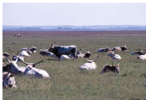
Ungarische Steppenrinder in Sandeck

Die begangenen Wiesenflächen des Bereiches Sandeck - Zwikisch - Neudegg liegen weitgehend innerhalb des Nationalparkgebietes. Hier wurde vor allem im Lauf der letzten fünf Jahre seitens der Nationalparkverwaltung die Mahd sukzessive durch extensive Beweidung ersetzt, vornehmlich, um eine Verschilfung der Wiesenflächen zu verhindern. Hauptsächlich wird dies im Bereich östlich von Sandeck - Zwikisch - Neudegg mit einer Herde Ungarischer Steppenrinder durchgeführt, bei Sandeck und Illmitz auch mit Eseln, Pferden und Büffeln.