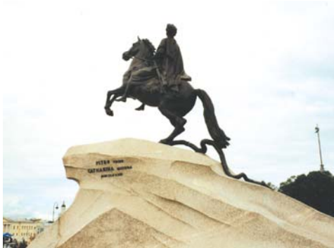
Peter der Große mit Schlange

wissenschaftliche Niveau dieser Veranstaltung in keiner Weise: 4 Tage hochkarätiges Vortragsprogramm in 2 Hörsälen und weit über 100 Poster!