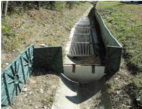
Teilsicht der Schutzanlage an der L 406

geführt und im Untersuchungszeitraum 2000/2001 das Artenspektrum mittels der „Zaun-Kübel-Methode“ erhoben: Triturus vulgaris , n=190; Triturus carnifex , n=4; Bufo bufo , n=5909; Rana temporaria , n=423; Rana dalmatina , n=173; Rana esculenta , n=249; Hyla arborea , n=1.